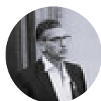
FABIO DEL BRAVO Direttore ISMEA