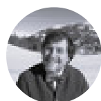
LUCA MERCALLI Climatologo e divulgatore scientifico