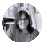
FRANCESCA PETRINI Presidente Nazionale CNA Unione Agroalimentare