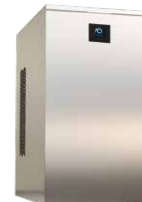
Erogatore S - M Sotto banco