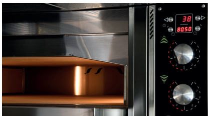
Interno camera e pannello comandi Internal deck and control panel