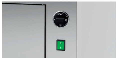
Regolazione temperatura cella di lievitazione Temperature adjustment proofer