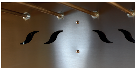
Scarico fumi fondo camera Fumes discharge deck bottom