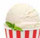
AMERICAN ICE CREAM