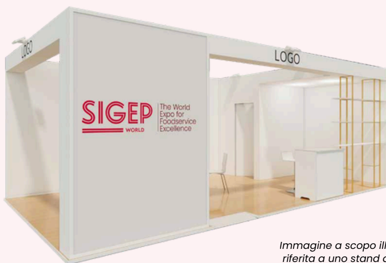
Immagine a scopo illustrativo riferita a uno stand da 27 mq