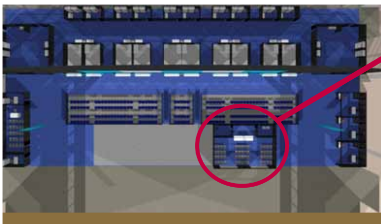
Layout Campionato Mondiale della Pasticceria