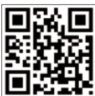
Scopri tutti gli strumenti S.D.M.

Per conoscere tutti gli strumenti SDM contatta Ufficio Marketing Diretto Tel. 0541 744643 Fax 0541 744772 sigepdirect@riminifiera.it